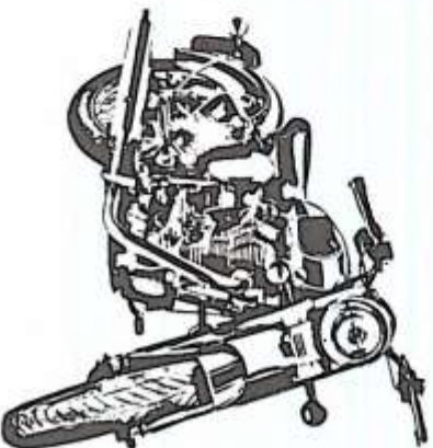
FOTO 10 X 14 VISTA 3/4 ANTERIORE LATO DESTRO (grattare con punti metallici)